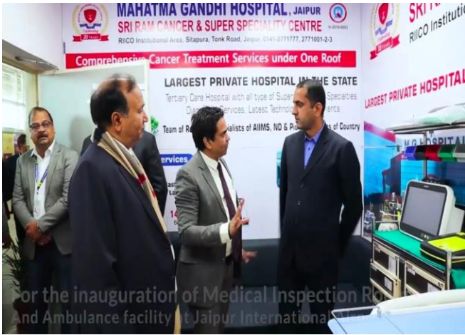
For the inauguration of Medical Inspection Room And Ambulance facility at Jaipur International