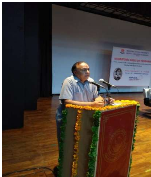
World Nursing Day